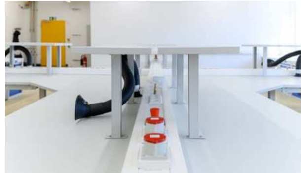
Wirkungsvollen Schutz vor elektrischen Auf- und Entladungen sowie vor Spannungsdurchschlägen – an den ESD-Arbeitstischen wurde das berücksichtigt.

Mit dem Arbeitsplatzsystem «Workflex» aus dem Hause Krieg konnten verschiedene Inseln und Buchten in der bisherigen Maschinenhalle als fortlaufend angebaute Ar-