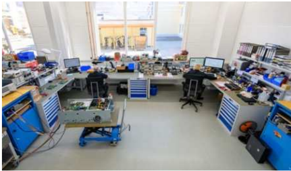
Fliessende Arbeitsschritte in strukturierten Bahnen zu schaffen – das war eine der Anforderungen an die neuen Arbeitsplätze.

verfügen wir über hoch qualifizierte Mitarbeiter und modernstes Equipment. So besitzen wir beispielsweise ein eigenes Röntgenlabor, über 100 Prüfstände und drei separate Testräume für die Durchführung der Dauertests», erklärt Schunn. Im Zuge des starken Expansionskurses wurden in den vergangenen zwei Jahren vielfältige bauliche Veränderungen vorgenommen. Neue Gebäude wurden zugekauft, Abteilungen verlegt und vergrössert. Auch die ehemalige Maschinenhalle wurde umfunktioniert: Durch den Einzug einer Zwischendecke entstanden sowohl im Erdgeschoss als auch im ersten Stock weitläufige neue Flächen. Dort, wo einst grosse mechanische Teile instandgesetzt wurden, hielt jetzt die neue Elektronikwerkstatt Einzug. Zur Bearbeitung grosser Baugruppen, deren Handling zum Teil den Einsatz eines Gabelstaplers notwendig macht, wurden im Erdgeschoss zwei grosse ausladende Arbeitsbuchten eingerichtet. Im Obergeschoss wurden die Flure und zahlreichen Büroräume weitestgehend zusammengelegt. An den zehn grosszügigen Arbeitsinseln in U-Anordnung entstanden insgesamt 40 neue Elektronikarbeitsplätze.