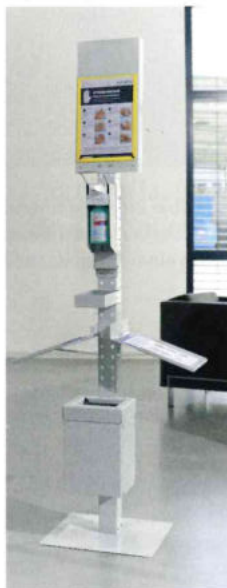
Krieg: Hygienestation Cleanspot.

Krieg Industriegeräte 71296 Heimsheim Telefon (0 70 33) 30 13 25 verkauf@krieg-online.de www.krieg-online.de